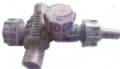
Colar de Tomada em Polipropileno para Tubo de 32mm x 20mm com registro

Não, informamos que o item ilustrado não atende a especificação da tabela de peças, pedimos considerar a peça conforme imagem abaixo.